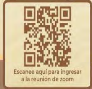
Escanee aquí para ingresar a la reunión de zoom

Más información Yessenia López / Claudia Pleitez : +1 (617) 625-0029